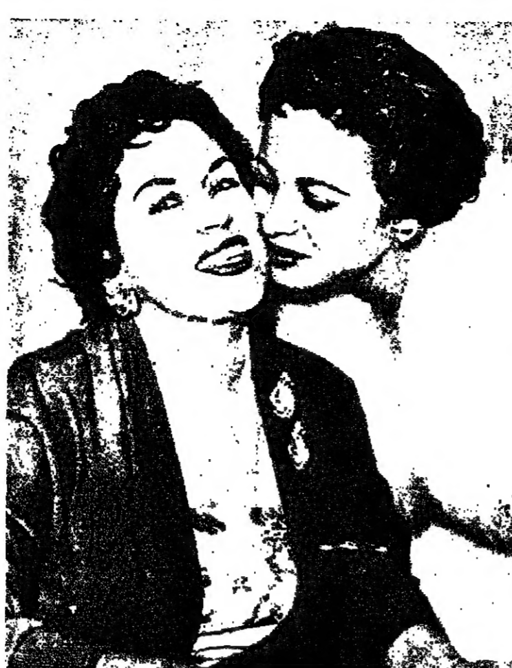
صورة من الأرشيف فانت حيامة وقبلة تقدير حارة على خد الفنانة الكبيرة ليلي مراد ..

كان اباطرة الصين الامتدسون اول من فكر في القيام برحلات الصيد لاقتناص الحيوانات المتوحشة ، وعرضها حية في حدائق قصورهم بضع الزينة والتجميل .. ومن هنا نشأت فكرة حديث الحيوان المعروفة في العصر الحديث .. وقد استحدثت اول حديقة امبراطورية للحيوانات الكاسرة في الصين عام الف قبل الميلاد في عهد اباطرة أسرة «شو» وكانت اول مجموعة نادرة من الحيوانات المتوحشة في ذلك الوقت .. وكان طعم الوحوش في ذلك الحين يتألف من اسرى الحروب والجرمين المحكوم عليهم بالاعدام ..